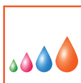
Piezo Variable Drop