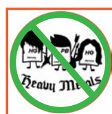
Free of Heavy Metals