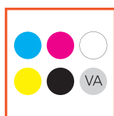
CMYK, Clear & White