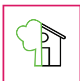
Esterni / Interni